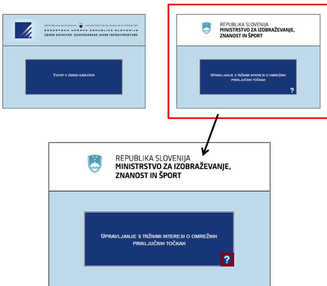
Slika 1: Modul za upravljanje s tržnim interesom

Navodila za modul upravljanja s tržnim interesom lahko najdete na osnovni strani spletne aplikacije.