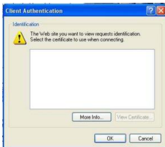
Slika 3: Opozorilno okno

Aplikacija, ki je nameščena na Ministrstvu za javno upravo in je dostopna le s kvalificiranim spletnim potrdilom, ki je lahko izdano s strani overoviteljev SIGEN-CA, SIGOV-CA, AC-NLB, POSTA-CA ali HALCOM. V primeru, da na računalniku uporabnik nima nobenega spletnega potrdila, se pri prijavi pojavi naslednje okno: