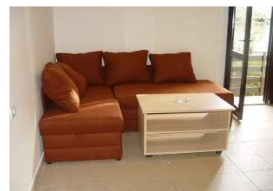
dnevno bivalni prostor