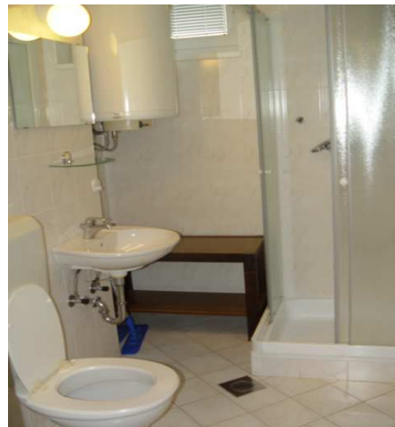
kopalnica z WC